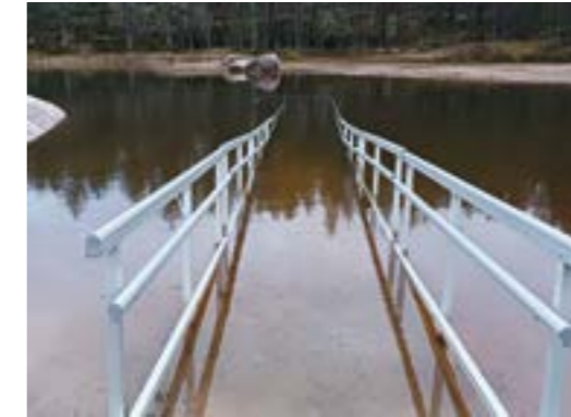
Esimerkkikuva kahluulaiturista Paimion Hiekkahelmen uimarannalta. Exempelbild på en badbrygga från Hiekkahelmi badstrand i Pemar.

Kahluulaituri asennetaan uimarannalle joulukuussa. Laiturin kaiteet kiinnitetään laituriin keväällä 2026.