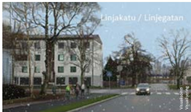
Linjakatu / Linjegatan

Suunnittelutyö aloitettiin loppuvuonna 2024, ja katusuunnitelma hyväksyttiin teknisessä lautakunnassa tänä vuonna. Rakentaminen on jo aloitettu, ja sen arvioidaan valmistuvan vuoden 2026 kesällä.