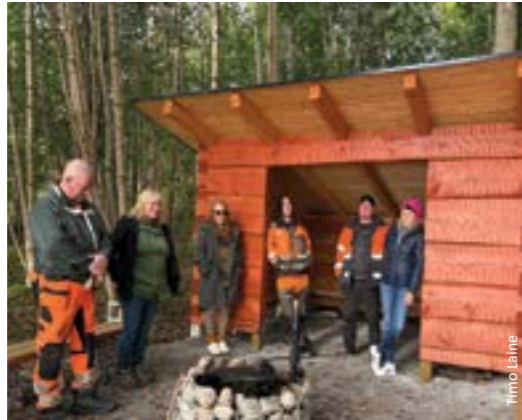
Kuntatekniikan henkilöstöä Lappohjan laavulla. Kommuntekniikens personal vid vindskyddet i Lappvik.

Lappohjan laavu sijaitsee kyläyhdistyksen vuokraaman, ns. tanssilavatonin rannassa, kaupungin omistamalla alueella. Lappohjan laavu on suunniteltu esteettömäksi. Tontille on tehty pieni esteetön parkkipaikka ja esteetön kulku laavulle asti.