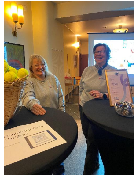
Utbildningsmässa i Hangö stadshus