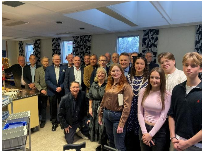
Självständighetsdag i Hangö gymnasium