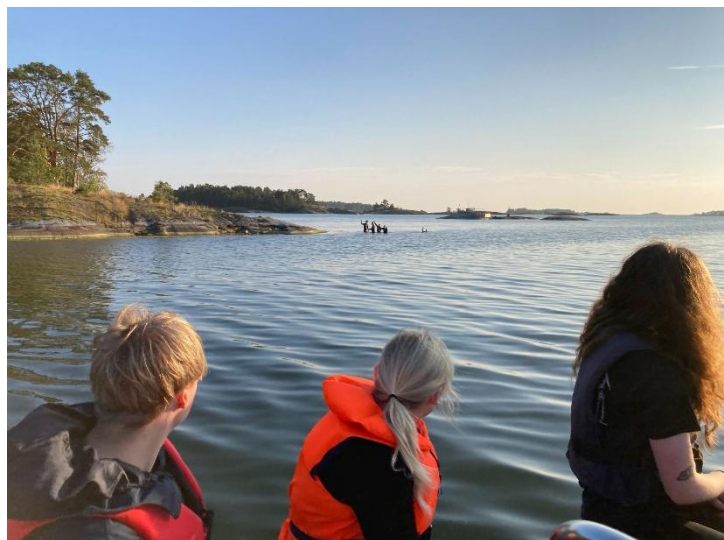
Vänstra bilden: Fältkurs i marinbiologi 29-30.4.2026. Från gymnasiet deltog 15 studerande. Högra Bilden: Kvällsprogram i form av snorkling under Functional coastal ecology den 8-12.9.2026.