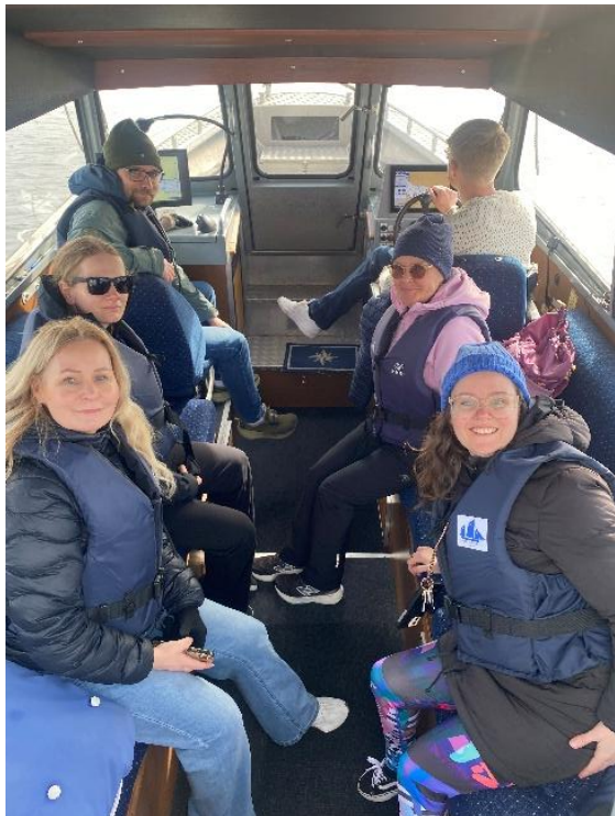
Gymnasielärarna åkte på studiebesök till Marina läroverket i Stockholm i april