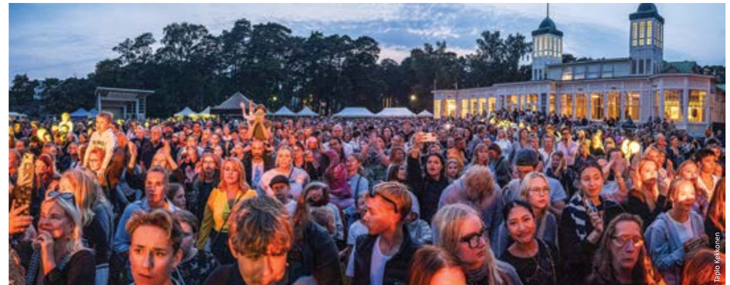
Hanko täydessä loisteessaan - elokuinen Kansanjuhla keräsi arviolta 8000 kävijää, ja täytti kaupungin musiikilla, tanssilla, ruoalla ja yhteishengellä.

Kiitämme kaikkia juhluvuoden tapahtumissa mukana olleille!