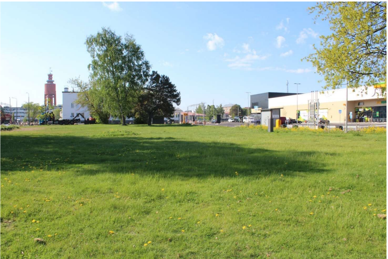
Bild 1. Bild över Stationstorget våren 2024

Stationstorget är idag en öppen, enkel park med några bänkar, ett planteringsområde med låga perenner, träd och gräsmatta. Ett tiotal större träd växer längs kanterna av Stationstorgets park. Det finns 3 stora björkar på Brandkårgatans sida och 2 stora ekar på Esplanadens sida. Bredvid stationsbyggnaden växer en tall och några ädelträd, asklönnar. De vackra barrträdsplanteringarna blev under vägen och parkeringsplatsen till det byggda köpcentret.