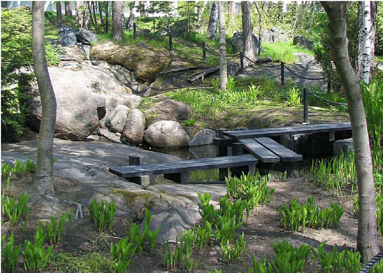
Bilderna 8, 9 och 10 olika parkelement

I parkens nordvästra del anläggs en grund vatten- eller stenbassäng med stegbrädor av trä i japansk stil. Bassängen dekoreras med natursten och en mängd olika växter som passar in i parken.