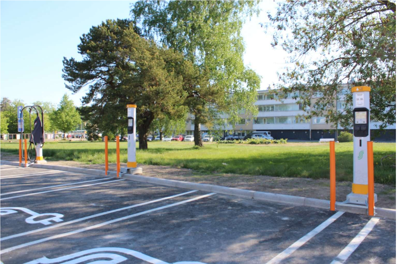
Bilderna 2, 3 från Stationstorget