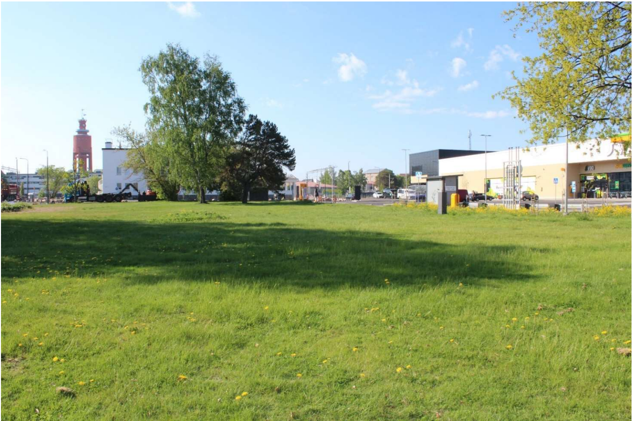
Kuva 1. Asematorin kuva 2024 keväällä

Asematorilla on tällä hetkellä avoin pelkistetty puisto, jossa on muutama penkki, matala perennojen istutusalue, puita ja nurmikkoja. Asematorin puiston reunoilla kasvaa kymmenisen isompaa puuta. Palokunnan kadun puolella kasvaa isoja koivuja 3 kpl ja Esplanadin puolella 2 kpl isoja tammia. Asemarakennuksen vieressä kasvaa mänty ja muutamia jalopuita, saarnivaahteroita. Kauniit havuistutukset jäivät rakennetun kauppakeskuksen tie- ja paikoitusalueen alle.