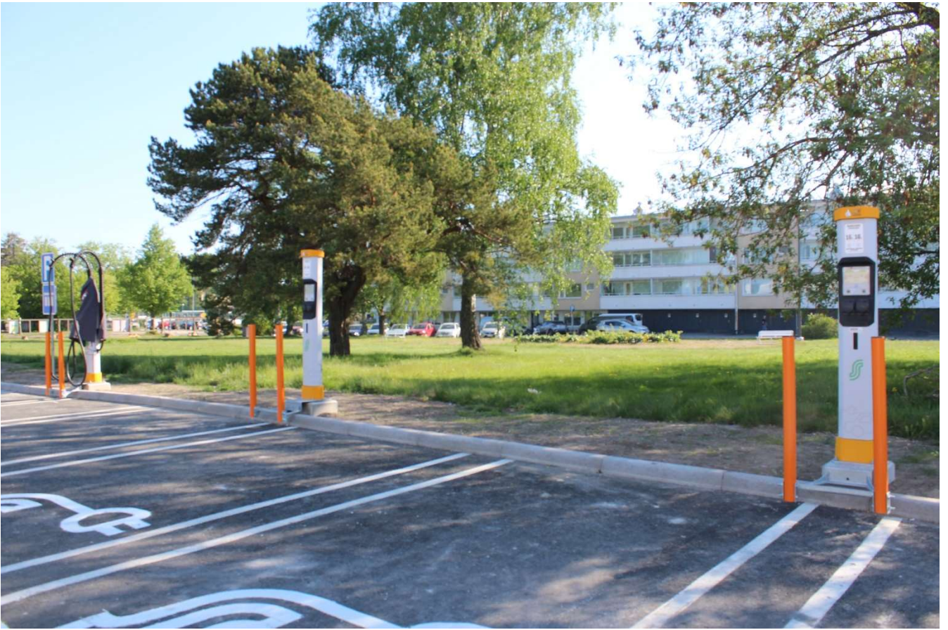
Kuvia 2, 3 Asematorilta