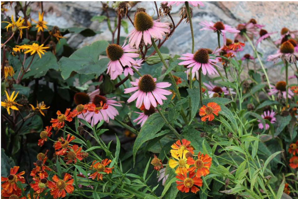
Röd rudbeckia och Helenium autumnale (Fjärilsbaren)