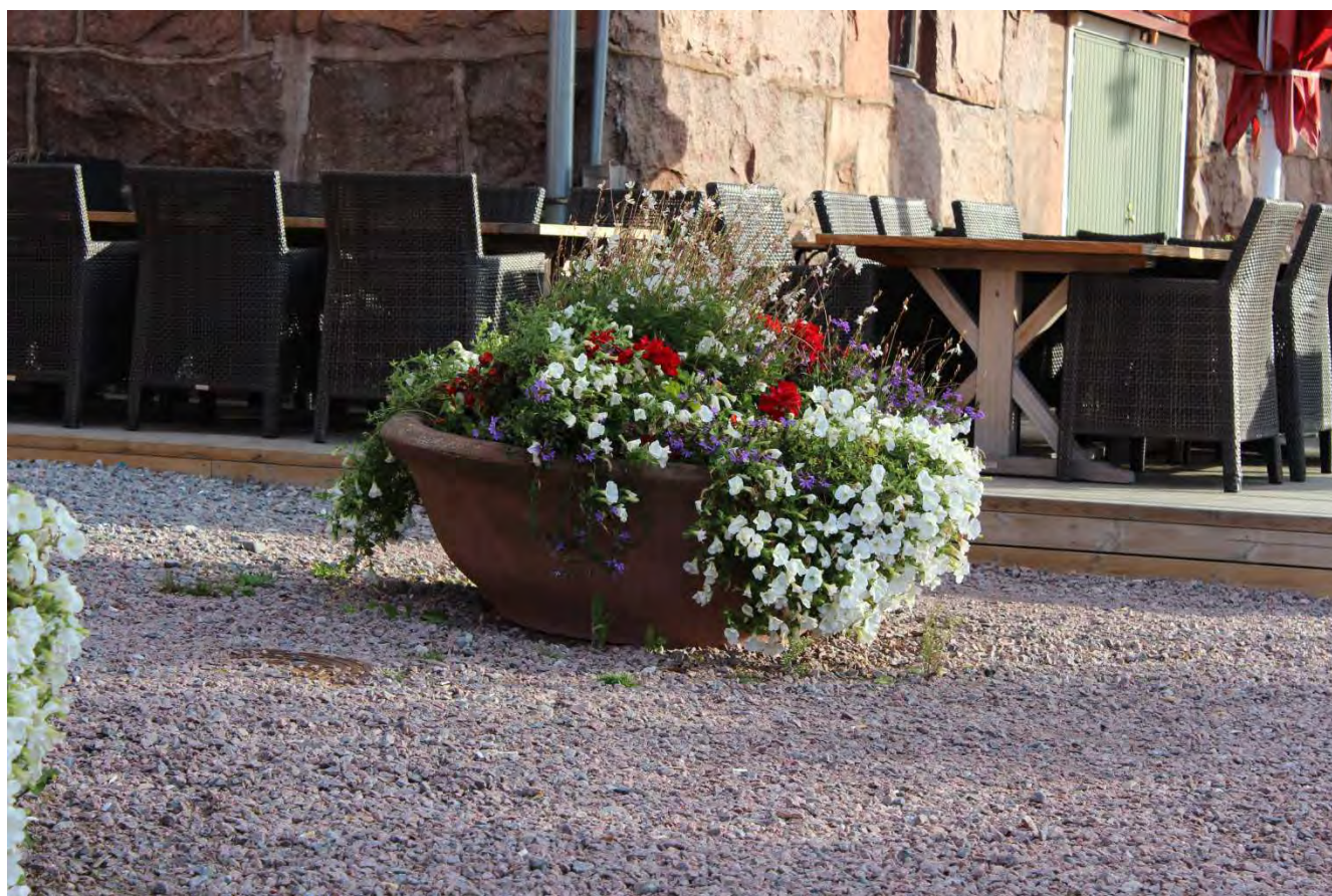
Stora blomkrukor längs Hamnvägen.