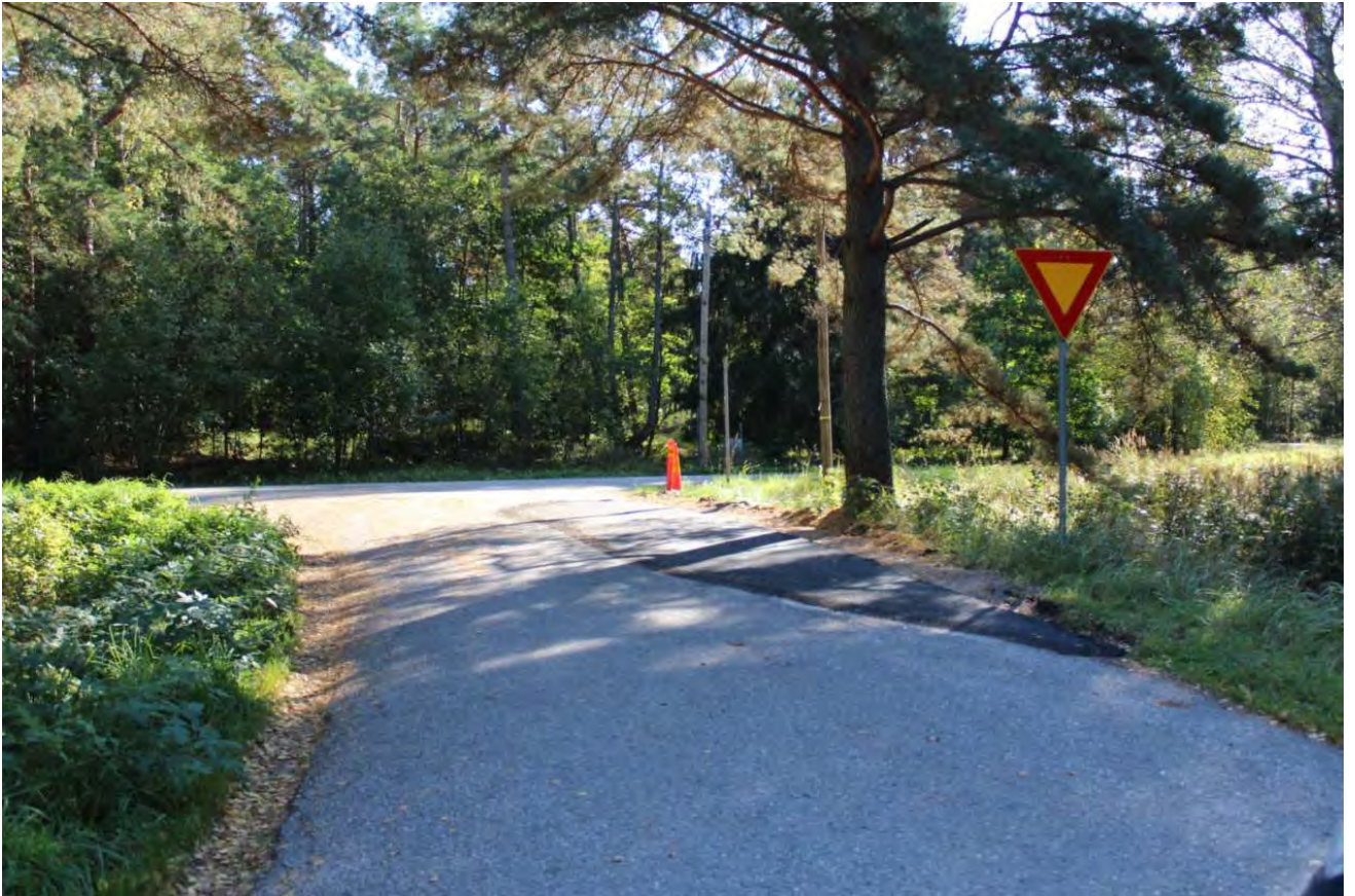
Skogsnäsvägen och Södergårdsgatan fick ny asfaltyta.