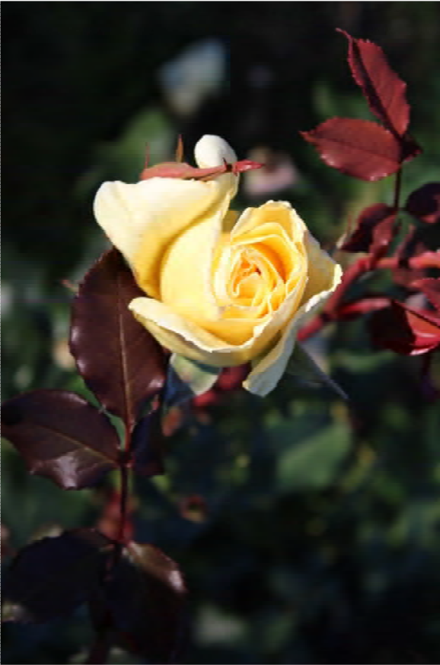
'Peace' (J.L.Lundmarks parken)