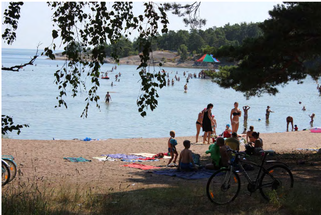
Stadens stränder var i flitig användning trots den kalla försommaren och julimånadens blågröna alger. På ovanstående bild Plagen badstrand och nordens eller eventuellt hela Europas enastående vattenkarusell.