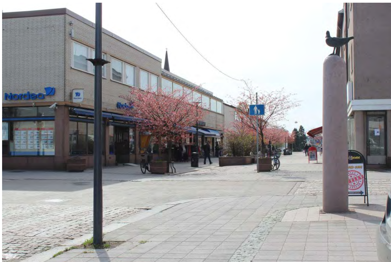
Gågatans körsbärsträd i full blom på våren.