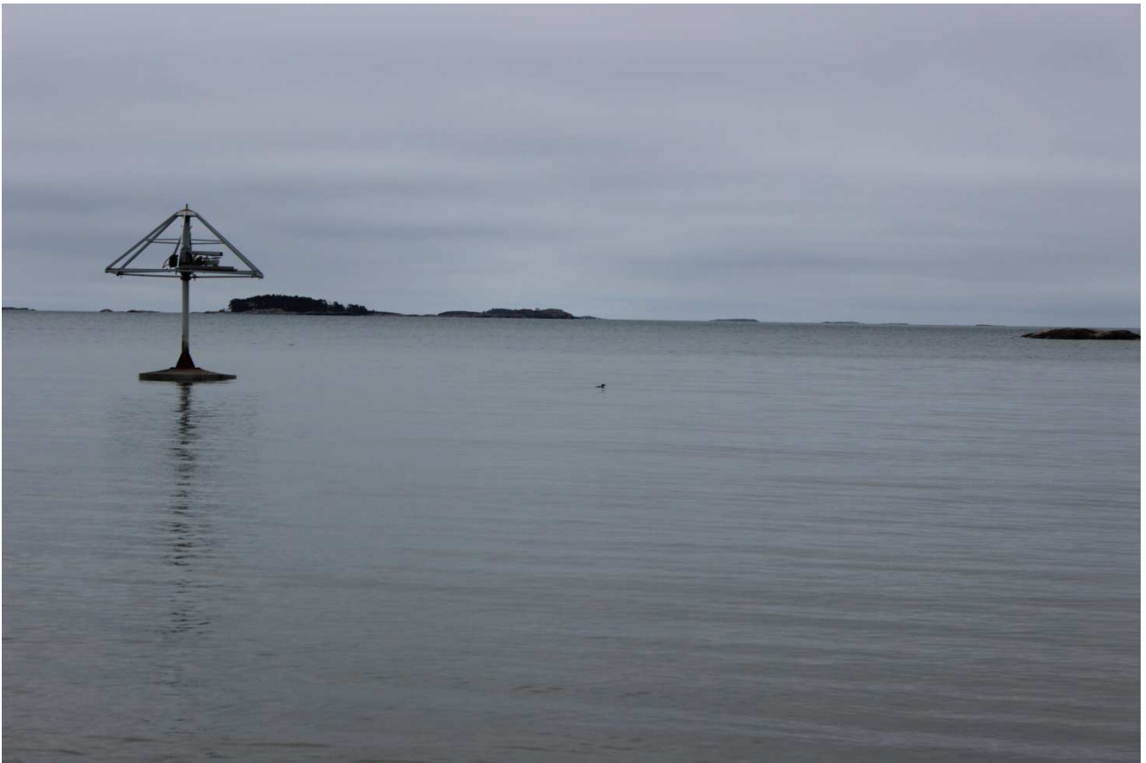
Karuselli odottaa varjoaan.