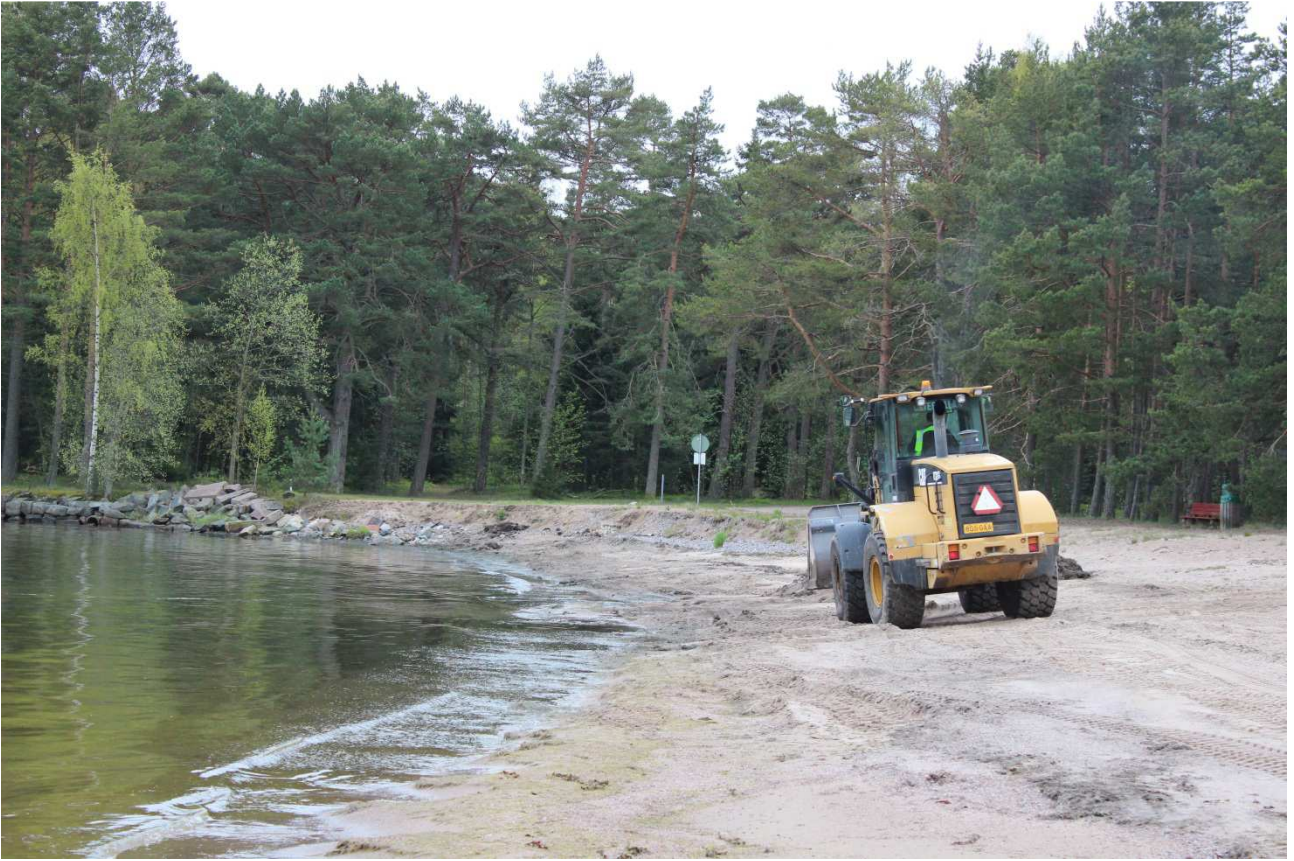
Plagenin rannan siivousta.