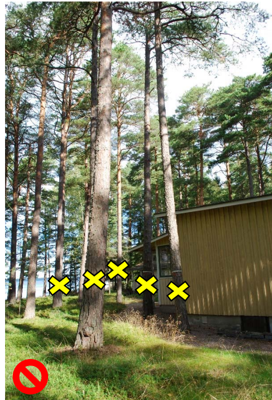
EI VÄHÄINEN: RAIVAUS RANTATONTILLA, JOSSA RAKENNUS NÄKY YMERKITTÄVÄSTI ENEMMÄN RANNAN PUOLELTA TOIMENPITEEN JÄLKEEN