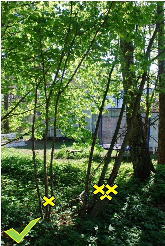
VÄHÄINEN: VESAKON JA PIENTEN PUIDEN RAIVAUS