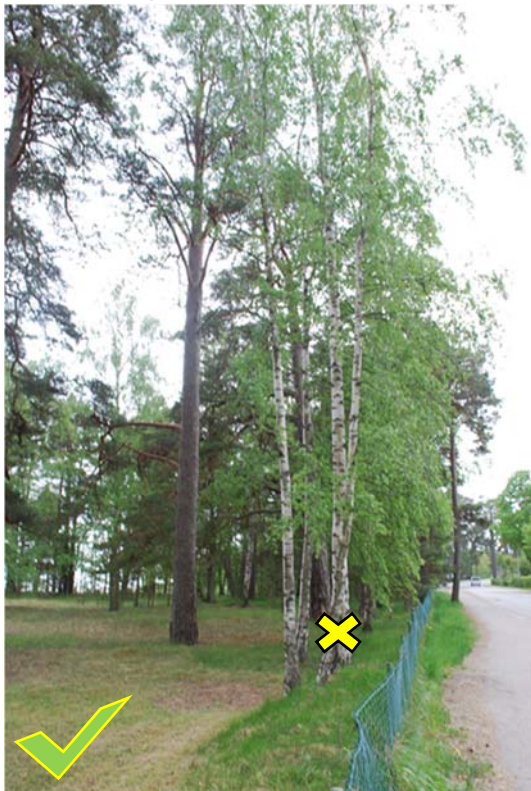
VÄHÄINEN: YKSITTÄISEN PUUN POISTO PUUSTOSTA/RYHMÄSTÄ