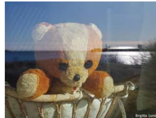
Nalle ikkunassa Gunnarsinrannassa. Nalle i Gunnarsstrandfönster.

Hangö museum dokumenterar människors coronaerfarenheter