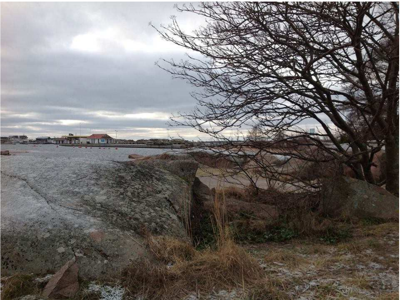
Den planerade stigen runt Fabrikssudden är även lämplig för rörelsehindrade.