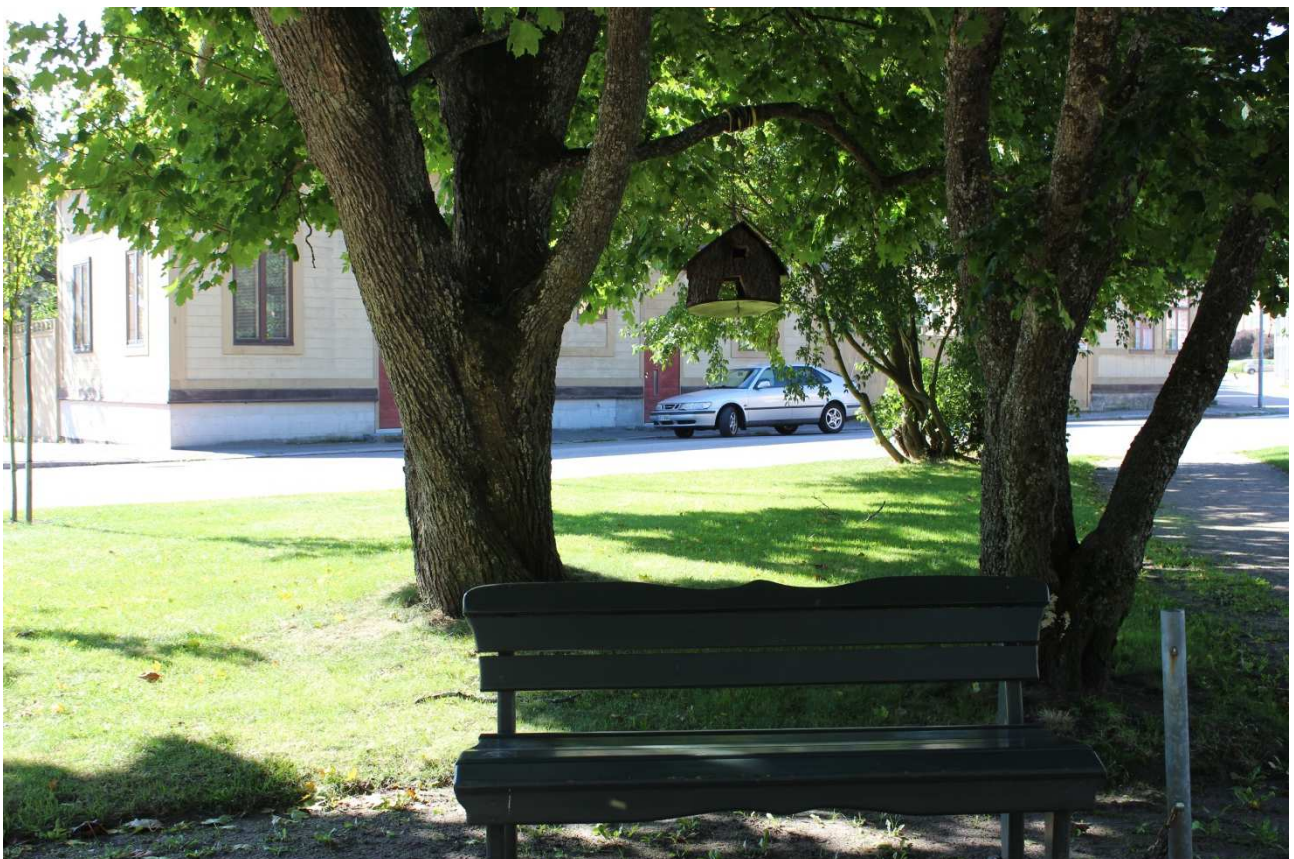
Vintermatningsplats för fåglarna.