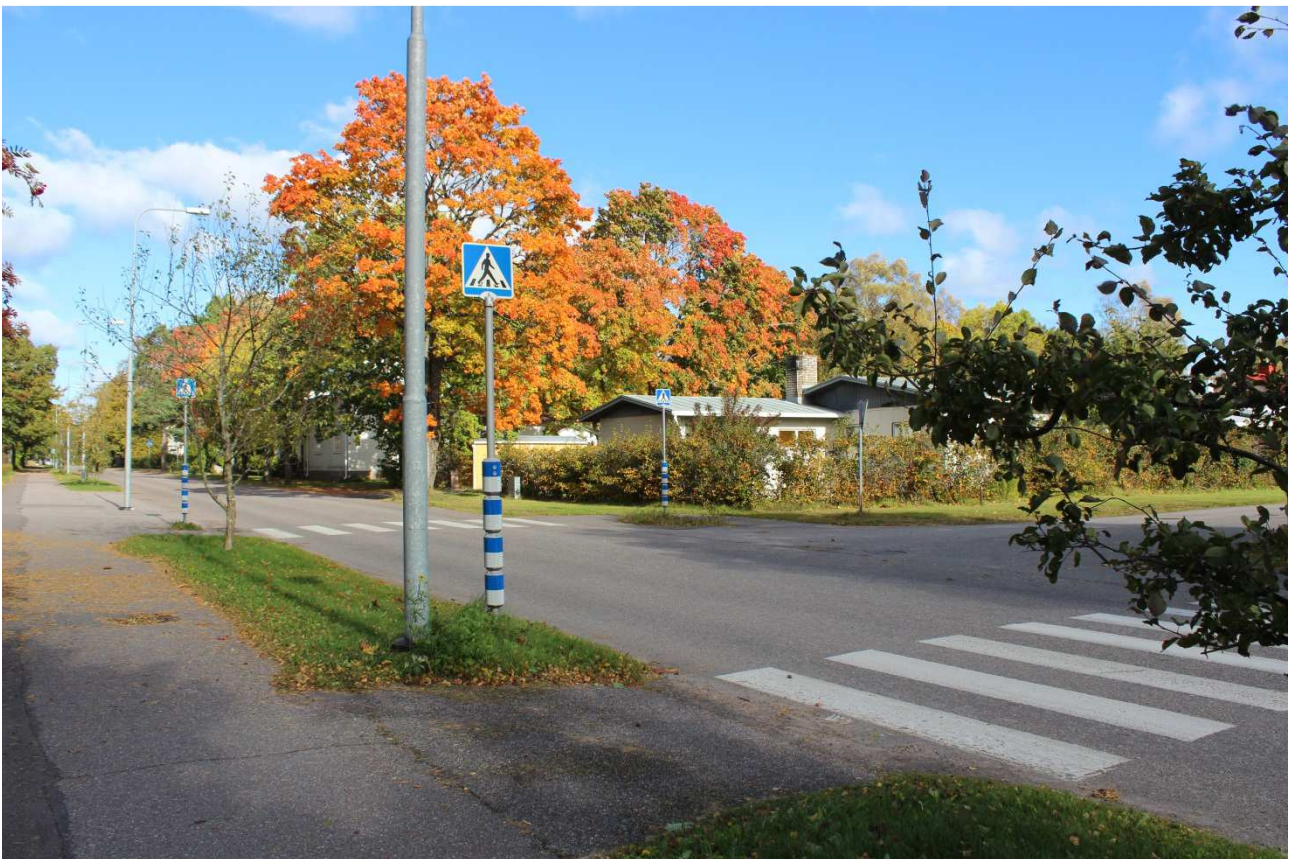
För att förbättra skolelevnas säkerhet, har man planerat ett farthinder vid en farlig korsning nära Hangöbyskolan. Den förhöjda skyddsvägen byggs så fort som möjligt.