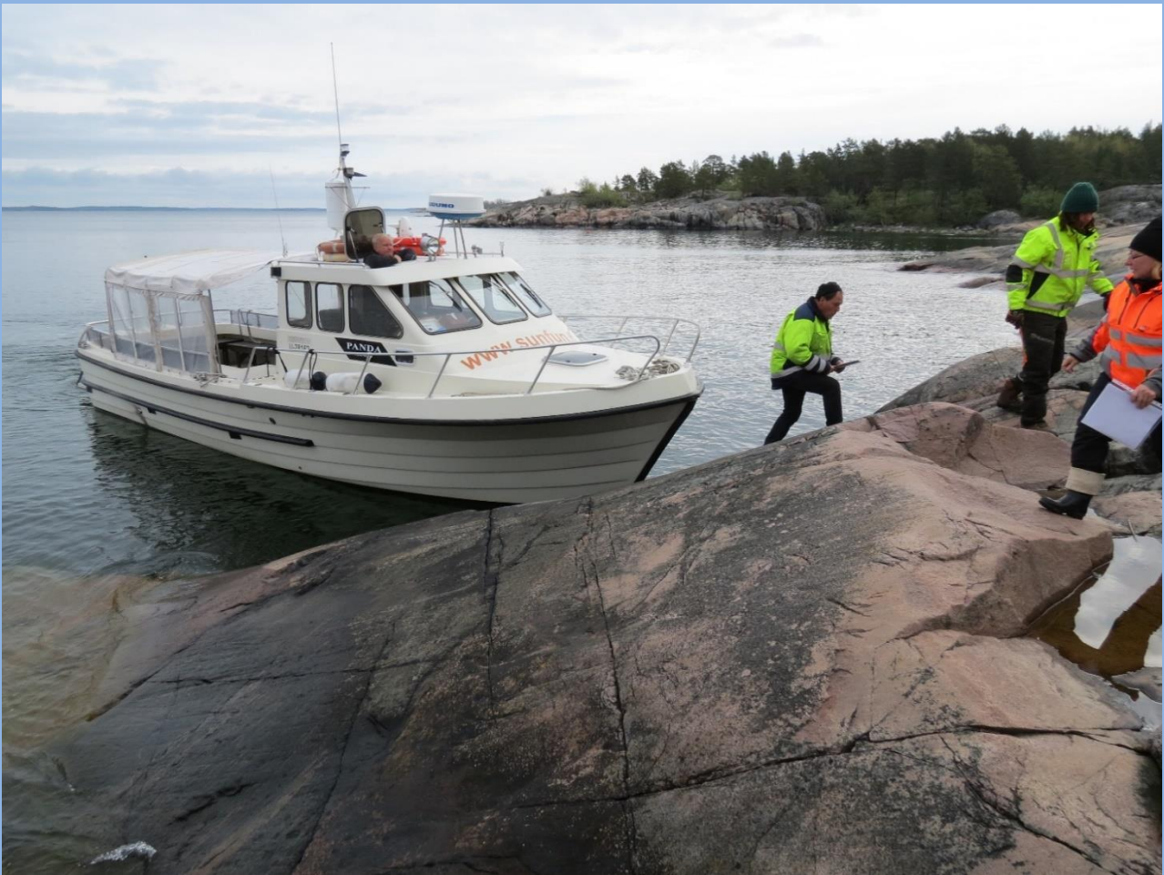
Bild över ett kartläggningsbesök på Gunnarsören.