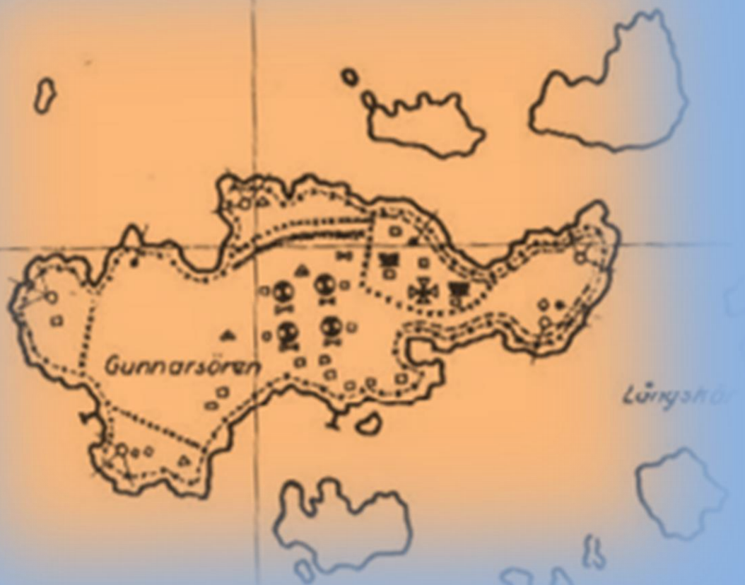
Bild över det krigstida luftvärnsbatteriet på Gunnarsören.