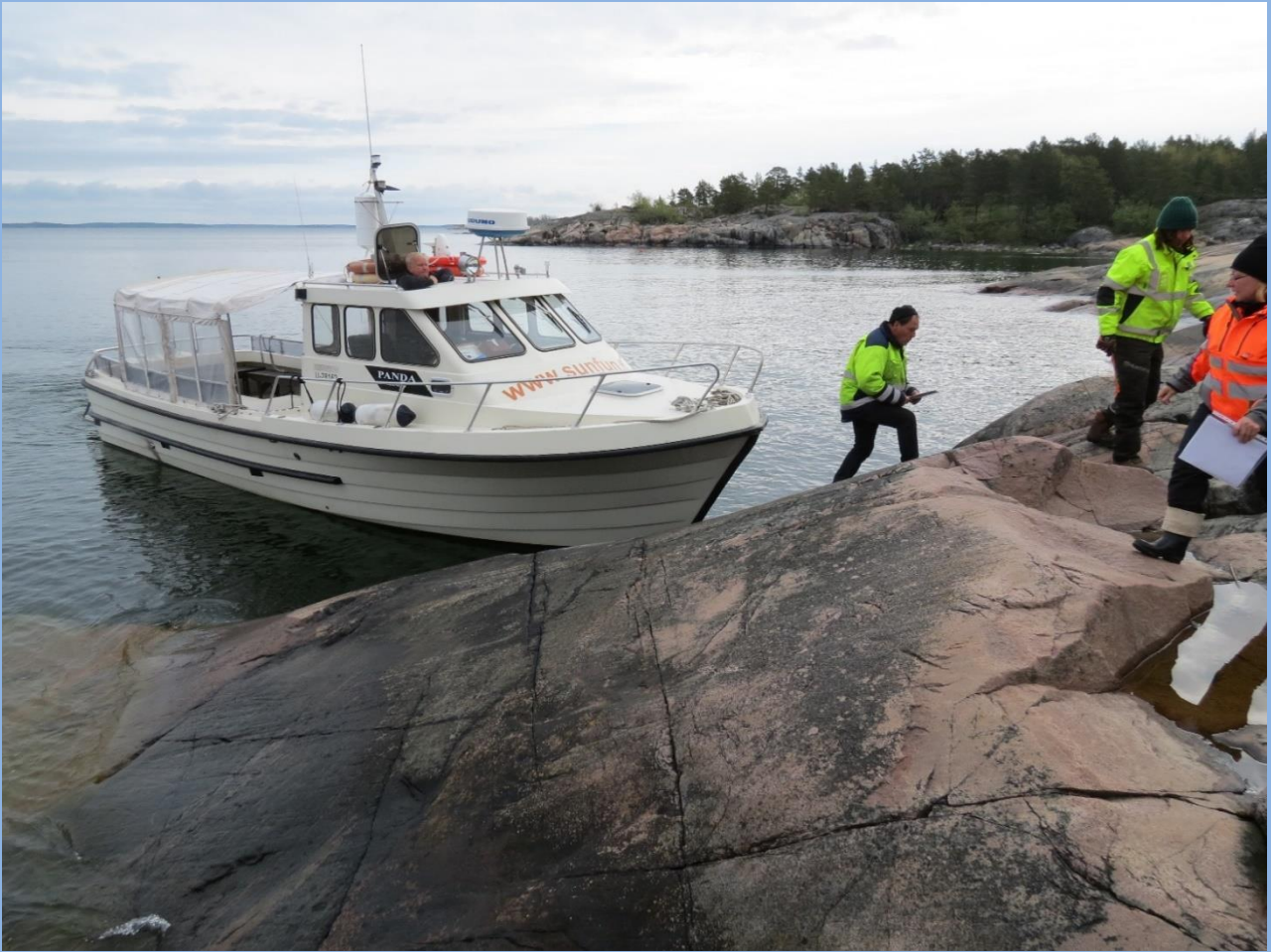
Kuva Gunnarsörenin kartoituskäynnistä.