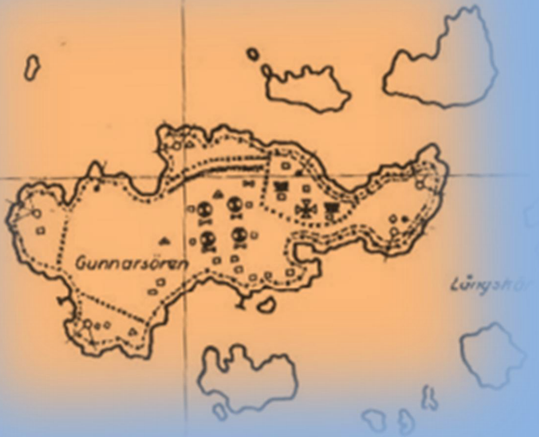
Kuva Gunnarsörenin sotailmavoimapatteristosta