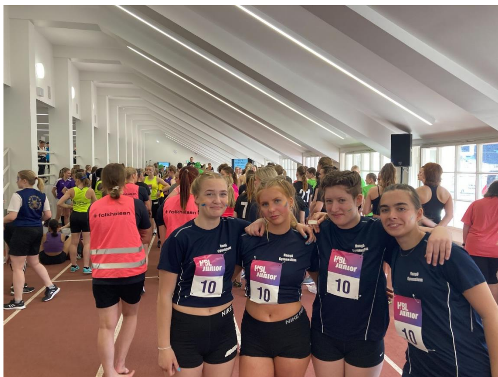
Flickornas lag i 4x100m på Olympiastadion den 20.5.2023