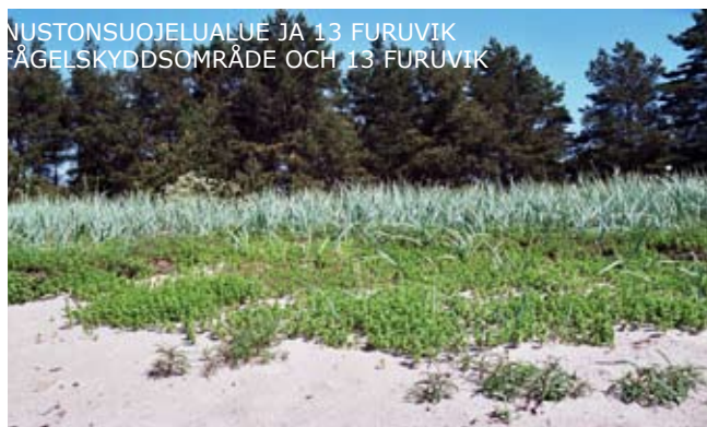
12 NATURA 2000-ALUEET: TULLINIEMEN LUONNONSUOJELUALUE JA LINNASTON SUOJELUALUE JA 13 FURUVIK NATURA 2000-OMRÅDEN: TULLUDDENS NATURSKYDDOMRÅDE OCH LÄGELSKYDDOMRÅDE OCH 13 FURUVIK

HANGON KANSALLINEN KAUPUNKIPIIUSTO HANGÖ NATIONALSTADSPARK