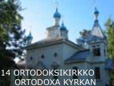
14 ORTODOKSIKIRKKO ORTODOXA KYRKAN