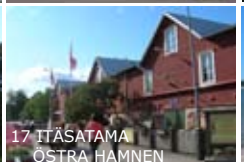
17 ITÄSATAMA ÖSTRA HAMNEN