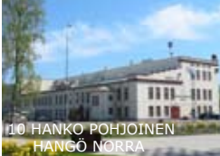
10 HANKO POHJOINEN HANGÖ NORRA