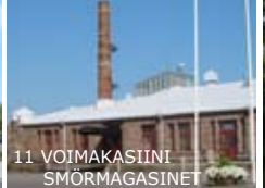
11 VOIMAKASIINI SMÖRMAGASINET