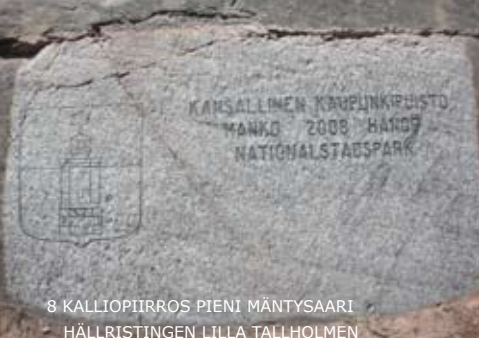
8 KALLIOPIIRROS PIENI MÄNTYSAARI HÄLLRISTINGEN LILLA TALLHOLMEN