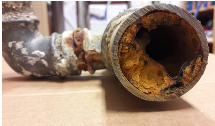
Yli 50 vuotta vanhat vesijohdot voivat kasvaa lähes umpeen ja heikentää veden laatua.

Kiinteistön ja vesihuoltolaitoksen vastuuraaja on vesijohtoverkon osalta runkovesijohdossa. Jätevesi- ja hulevesiverkoston osalta vastuuraaja on runkoviemäriässä tai liitoskaivossa. Myös kellari-tilojen padotusventtiili tai pumppaamo on kiinteistön vastuulla. Jos padotuskorkeuden alapuolisiin tiloihin tulvii viemäriävesiä, tulvasta aiheutuneet vahingot ovat kiinteistön omalla vastuulla.