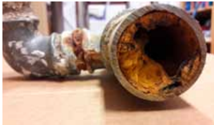
Över 50 år gamla vattenledningar kan nästan växa igen och försvaga vattnets kvalitet.

Ansvarsgränsen mellan fastigheten och vattentjänstverket är stamvattenledningen vad gäller vattenledningsnätet. I fråga om spill- och dagvatten-nätet är gränsen huvudavloppet eller anslutningsbrunnen. Fastigheten ansvarar också för en eventuell uppdrämningsventil i källaren eller ett pumpverk. Om det svämmer över avloppsvatten nedanför uppdrämningshöjden, svarar fastigheten själv för skadorna.